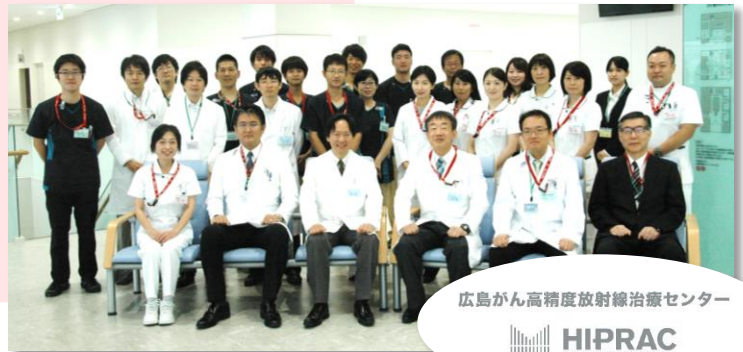
広島がん高精度放射線治療センター